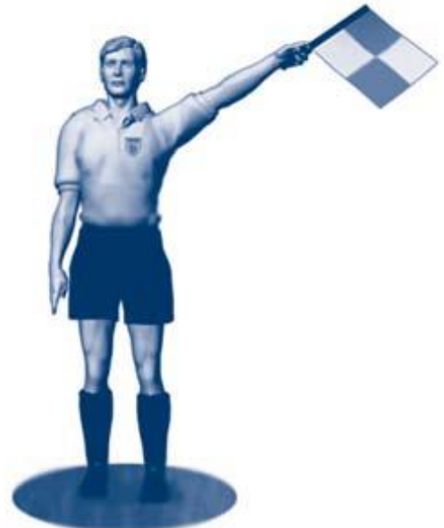
Innkast til forsvarende lag