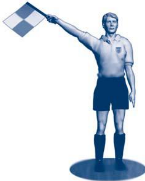
Innkast til angripende lag