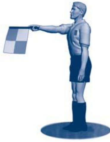
Offside midt på banen