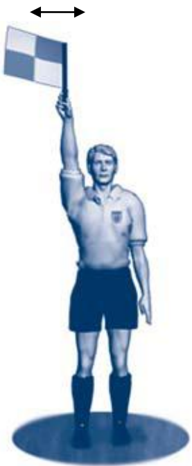
Frispark til angripende lag