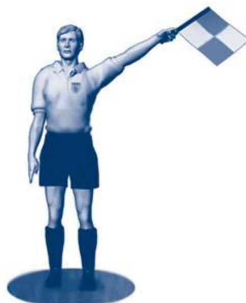
Innkast til forsvarende lag