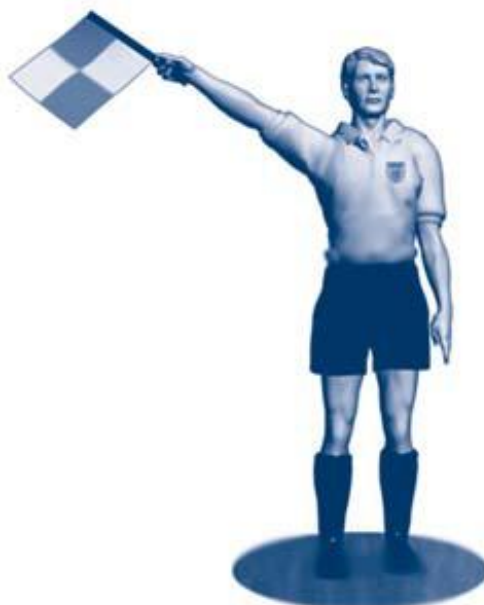
Innkast til angripende lag