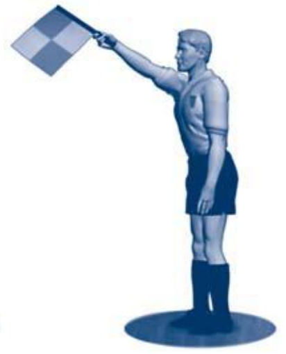
Offside på bortre del av banen