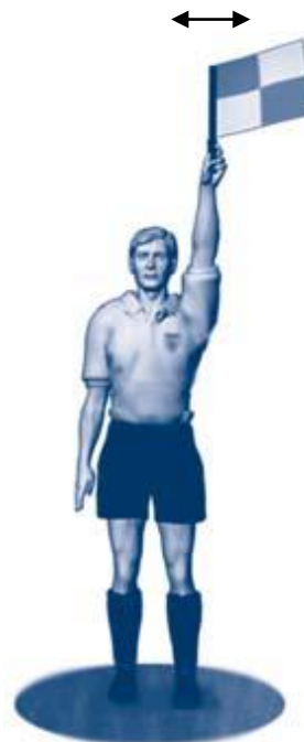
Frispark til forsvarende lag