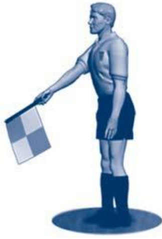
Offside nær AD